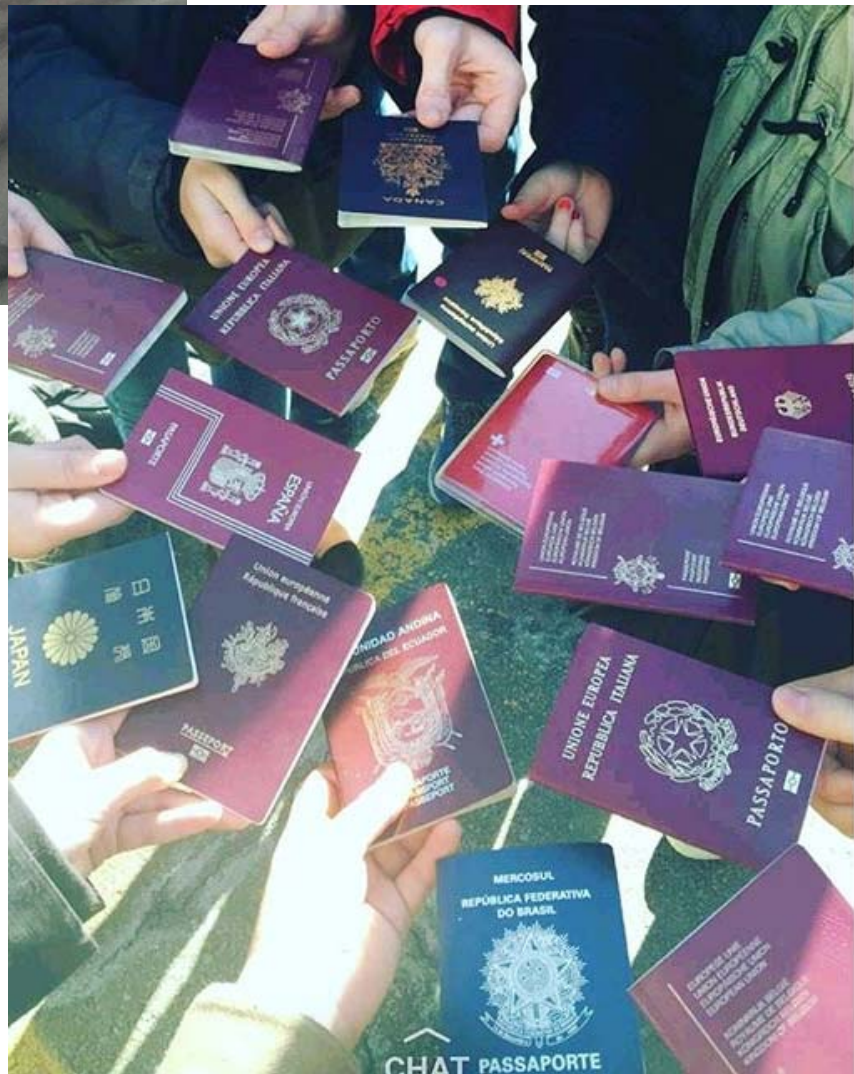
いろんな国のパスポート！