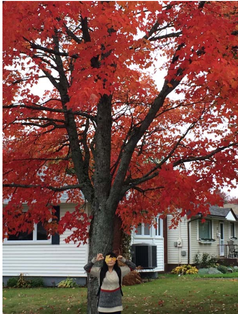
赤くなったメイプルツリー！