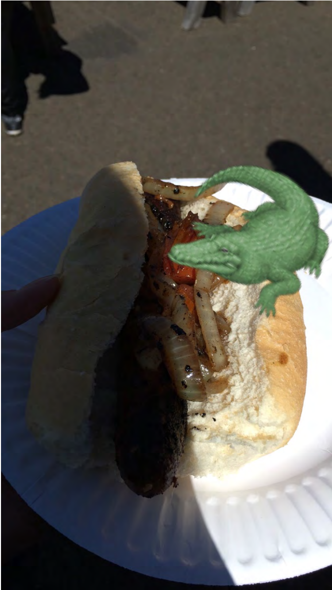
初めてワニの肉のソーセージに挑戦😬