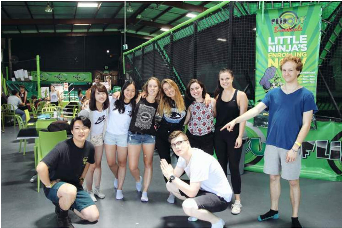
↑ ROTEX のトランポリン Day