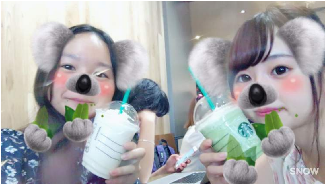
↑ まみちゃんと初めて会った日