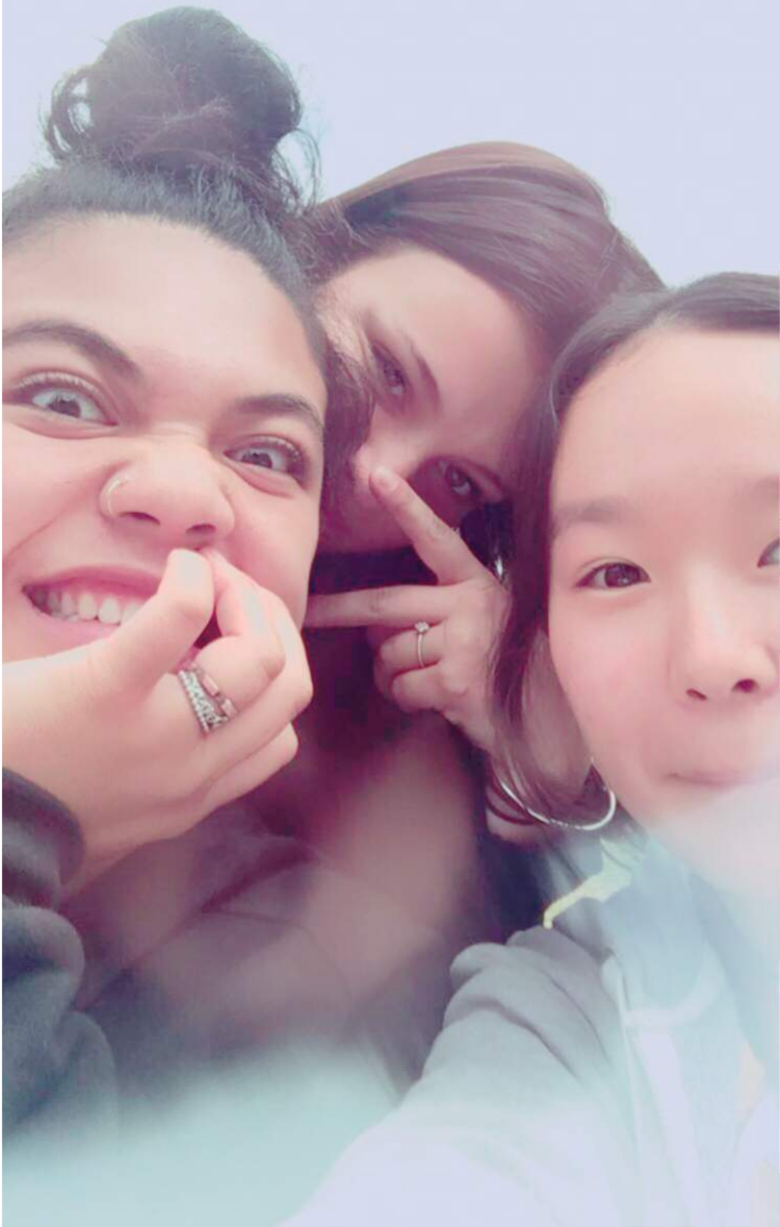
↑ 休み時間に友達と