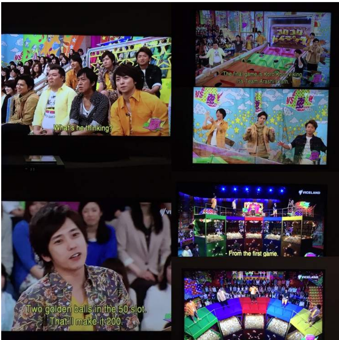
↑ VS 嵐オーストラリア ver