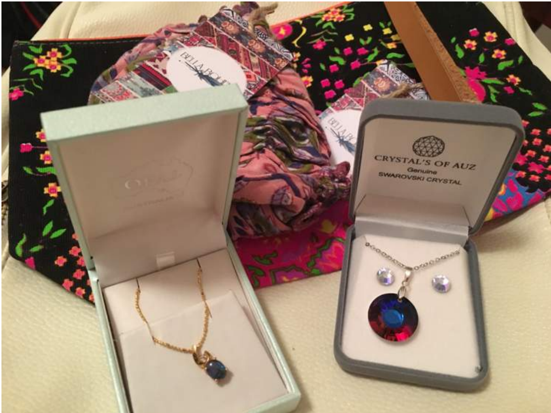
↑ Springwood Rotary から