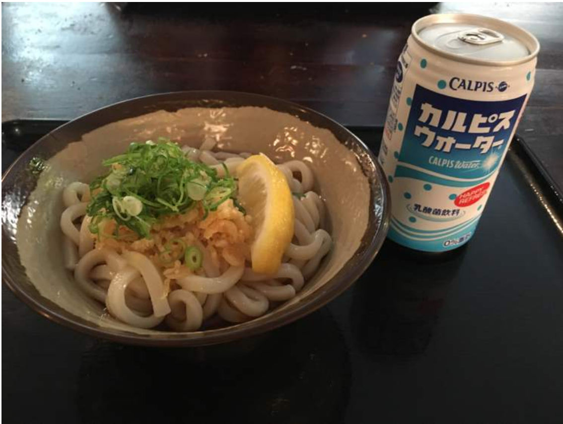
↑イザと Bridge Climb のあとにうどん