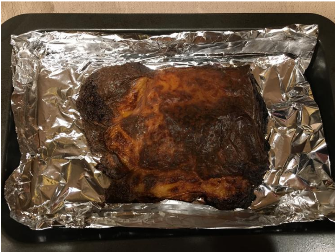
↑ オープンで焼いてるのを見てなかったらこんなにこげてしまったラザニア